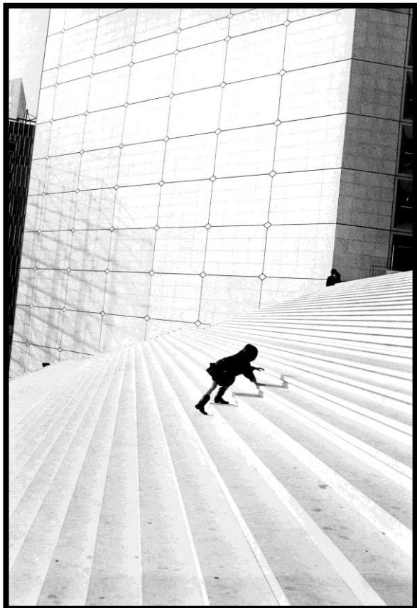
Enfant sous l'arche

Du 2 au 30 septembre : « Ailleurs », photographies argentiques de Tilo Rausch Ouverture du jeudi au dimanche de 14h à 17h