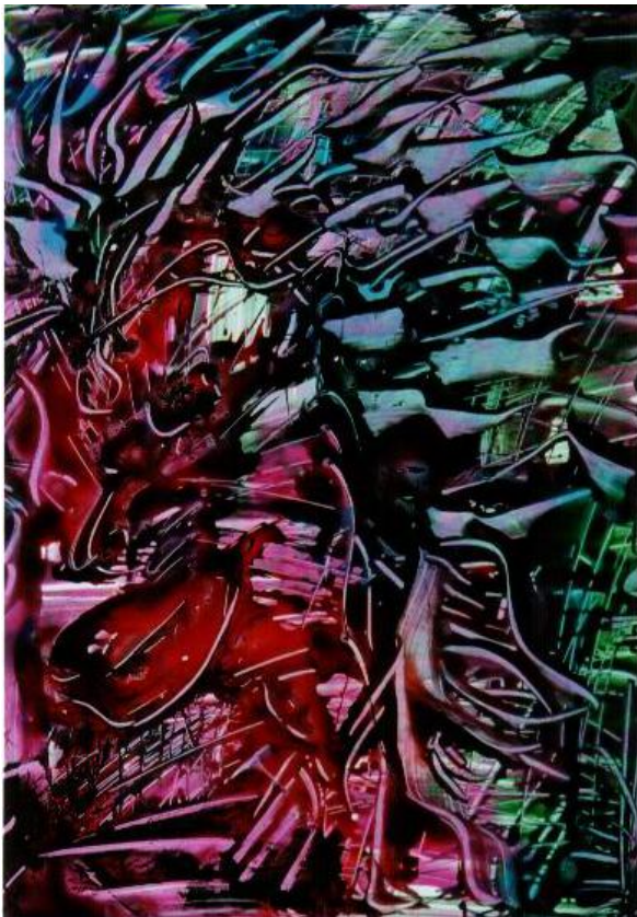
Amoreusement, encre sur papier 40X50 cm

Ses peintures reflètent ses états d'âme, ses pensées profondes, ses humeurs : couleurs vives ou teintes pâles, monde chaotique, détails multiples. Elles s'enchaînent les unes aux autres, la dernière trouvant sa source dans la précédente de manière à former un tout. Il utilise des encres sur papier glacé, ou travaille au couteau des peintures acryliques et glycérophtaliques.