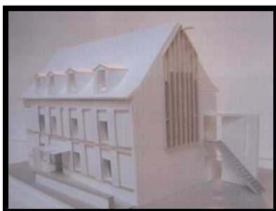
Image du projet en cours de réalisation

La Communauté de communes Sancy-Artense a entrepris la réhabilitation d'une ancienne maison bourgeoise, la Maison Garenne - du nom de son ancien propriétaire - dans le but d'accueillir en résidence, un artiste plasticien, chaque année d'avril à juin.