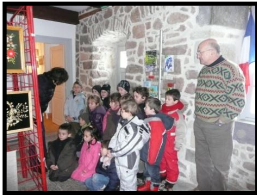
Découverte des Peintres russes par les enfants lors de l'exposition Hiv'Art 2010 (février – mars)