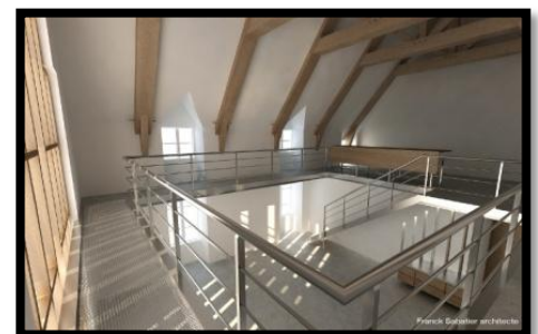
Image du futur atelier

La Communauté de communes Sancy-Artense a entrepris la réhabilitation d'une ancienne maison bourgeoise, la Maison Garenne - du nom de son ancien propriétaire - dans le but d'accueillir en résidence, un artiste plasticien, chaque année d'avril à juin.