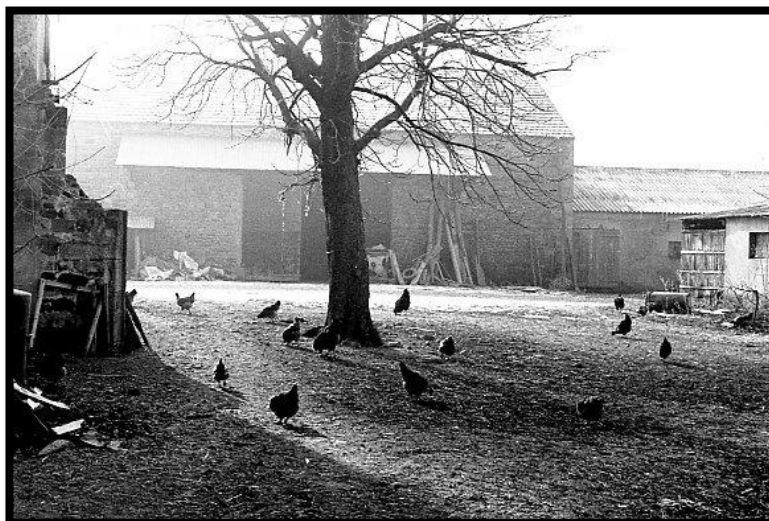
Cour de ferme

Toujours en alerte, il saisit l'atmosphère de la vie quotidienne, guette le détail inattendu, la lumière qui va donner à la composition grâce et poésie. Dans chaque image, les lignes dessinent un graphisme précis, rigoureux, les gris se déclinent en une multitude de nuances, et souvent humain et nature s'opposent. « Ailleurs » regroupe des images de nombreux pays dans lesquels Tilo Rausch a pu voyager : Allemagne, Chili, Etats-Unis, Espagne, France, Italie, Portugal, République tchèque et Russie.